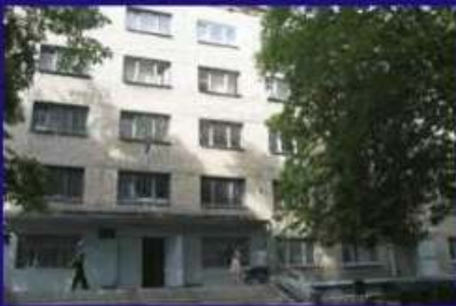
Гуртожиток 2, Отакара Яроша 7