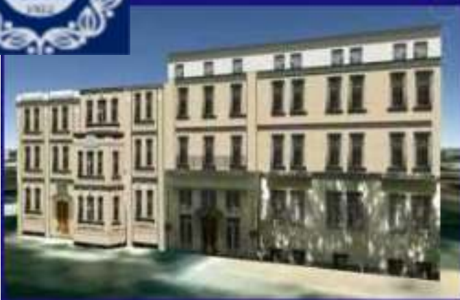
Гуртожиток 1, Ольмінського 15