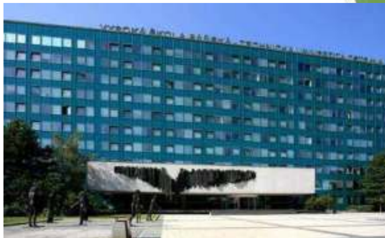
Technical University of Ostrava (Чехія)