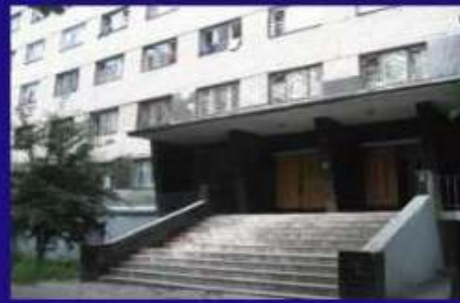
Гуртожиток3, Отакара Яроша 10