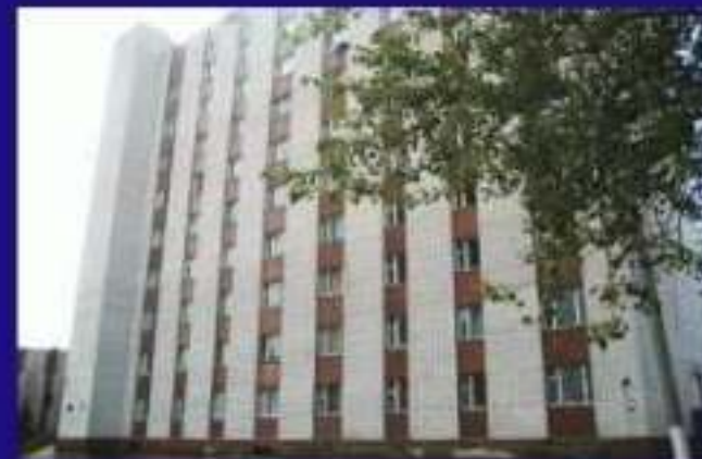
Гуртожиток 6, Отакара Яроша 6-б