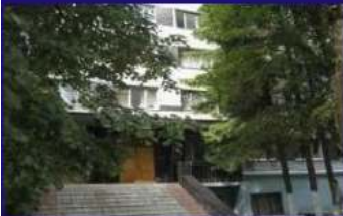
Гуртожиток 4, Отакара Яроша 12