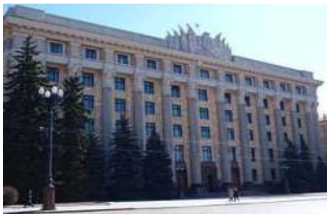
Органи місцевого самоврядування