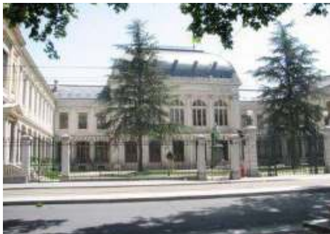
Університет Люм'єр, Ліон - 2 (Франція)