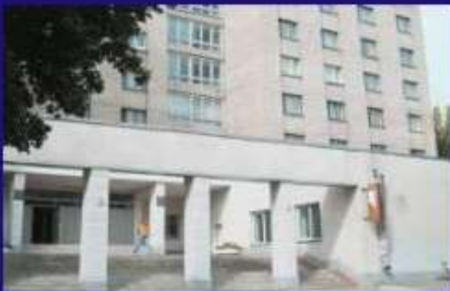
Гуртожиток 5, Клочківська 216-б