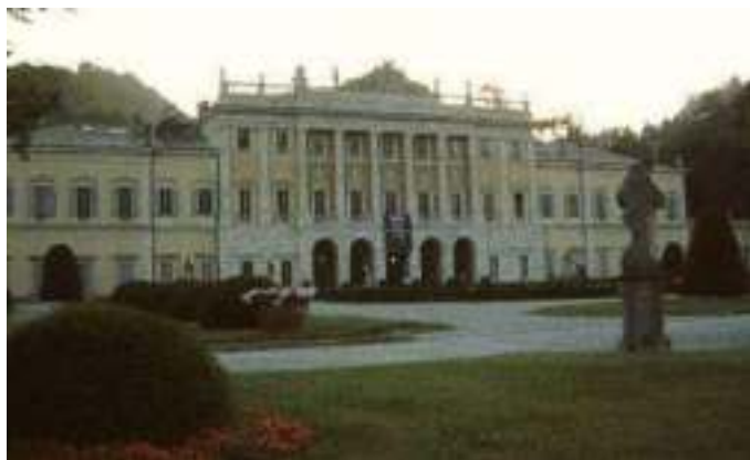
University of Insubria (Італія)

Завдяки співробітництву з університетами європейських країн, наші студенти мають можливість стажуватися, отримуючи цінний міжнародний досвід.